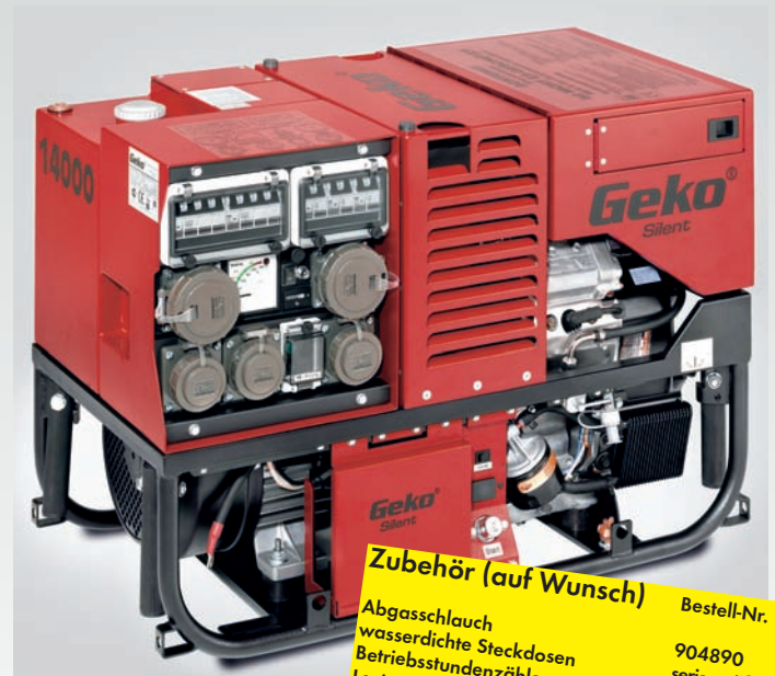
Abb.: 13002 ED-S/SEBA DIN 14685