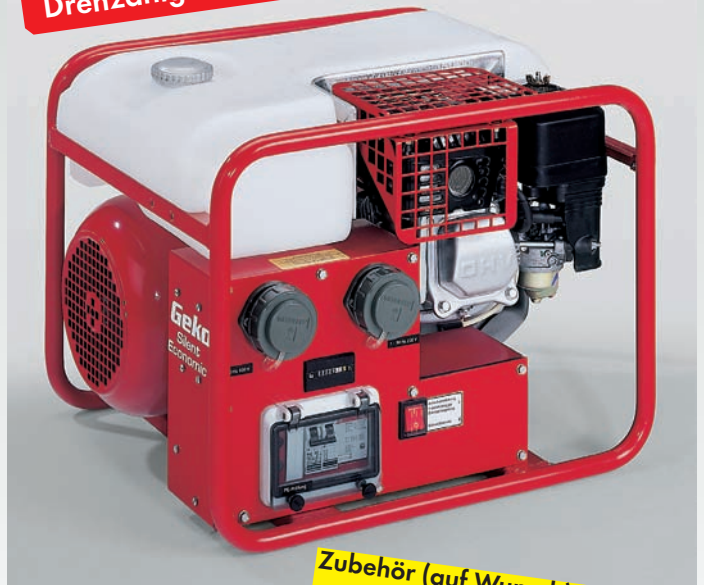
Abb.: 3000 E-AA/HHBA

Für Feuerwehren, Ölwehren, technische Hilfsdienste.