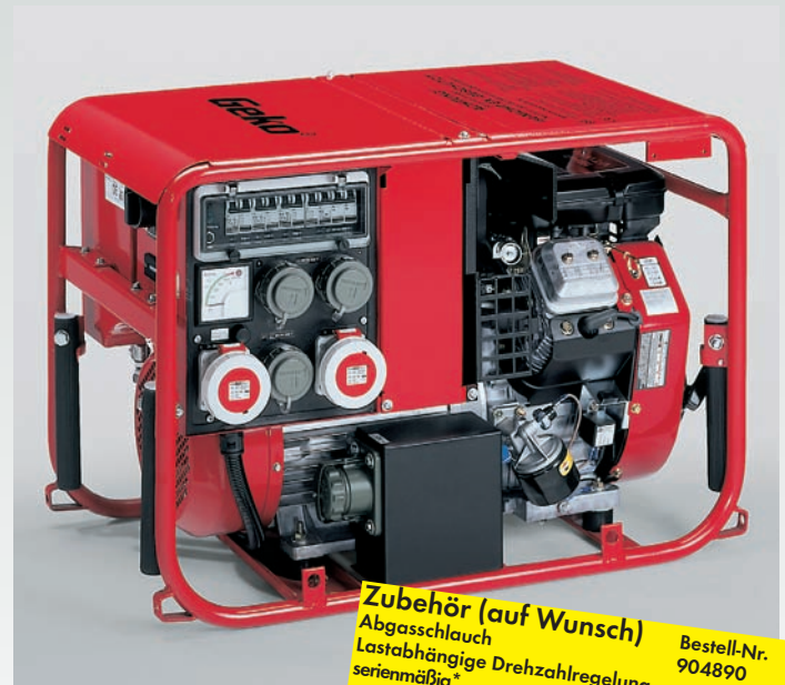
Abb.: 8000 ED-AA/SEBA DIN 14685

Zubehör (auf Wunsch) Mehrere Zubehörkomponenten auf Anfrage. Abgasschlauch Lastabhängige Drehzahlregelung Betriebsstundenzähler (Typ 6602) Betriebsstundenzähler (Typ 6600) wasserdichte Steckdosen Lastanzeige Schutzleiterprüfeinrichtung Fremdstartsteckdose Erdungsgarnitur Fahrgestell Fern-Start-Stop Bestell-Nr. 904870 serienmäßig* serienmäßig* 034300 serienmäßig serienmäßig serienmäßig serienmäßig 908250 988520 auf Anfrage