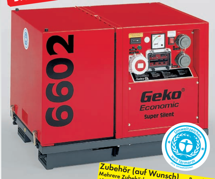
Abb.: 6602 ED-AA/HHBA

Serienmäßig mit abschaltbarer Anlaufverstärkung. Für Feuerwehren, Ölwehren, technische Hilfsdienste.